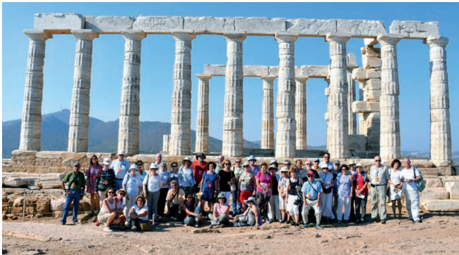
Viajeros de SEEC-Madrid en cabo Sunion (Viaje a las Cícladas, 2016)